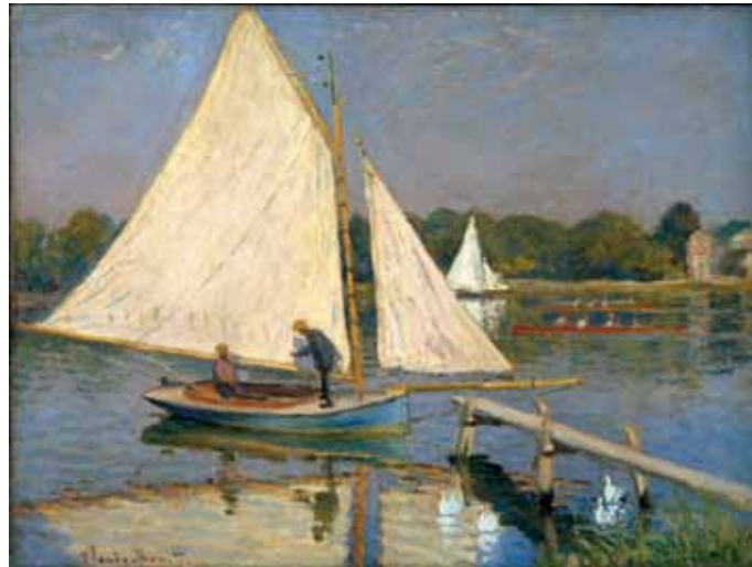
Claude Monet, Canotiers à Argenteuil, 1874 The Nahmad Collection

Si la collection semble suivre les canons de l'histoire de l'art, elle présente cependant des traits tout à fait individuels – tendant un arc de l'impressionnisme tardif avec Renoir et Degas à la fin du 19 ème siècle en passant par le cubisme et l'abstraction jusqu'au surréalisme: Magritte, Léger et Max Ernst se joignent au groupe exceptionnel de Joan Miró et forment un parcours véritablement étonnant à travers les temps forts des Modernes: The Nahmad Collection!