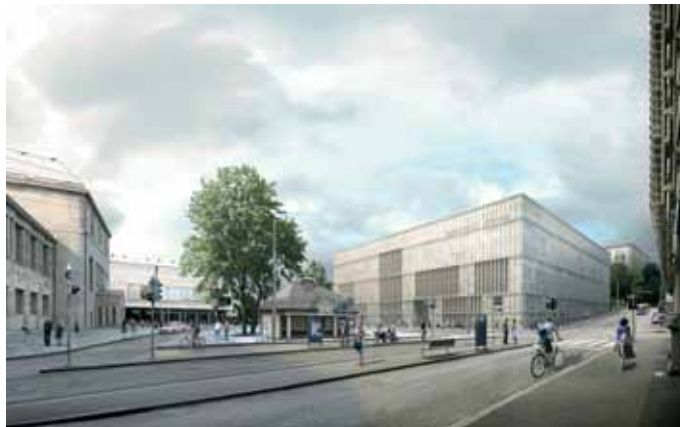
Vue du Heimplatz et de la façade avec la nouvelle entrée principale État 2011, après clôture de l'avant-projet, © David Chipperfield Architects

C'est parti! Les travaux d'agrandissement du Kunsthaus progressent rapidement, raison pour laquelle nous tenons à vous présenter dans la grande salle d'exposition ce qui est en train de voir le jour au Heimplatz. L'avance est telle que nous pourrions installer une série de grandes maquettes qui permettront de dévoiler d'innombrables détails architecturaux et de répondre à de nombreuses questions du genre: pourquoi fallait-il agrandir le Kunsthaus, pourquoi avoir fait appel à un architecte de renommée mondiale pour cette expansion, à quoi ressemblera, de l'intérieur comme de l'extérieur, le futur bâtiment au Heimplatz? Comment et où seront accueillis les futurs visiteurs et quelles prestations nouvelles leur seront proposées?