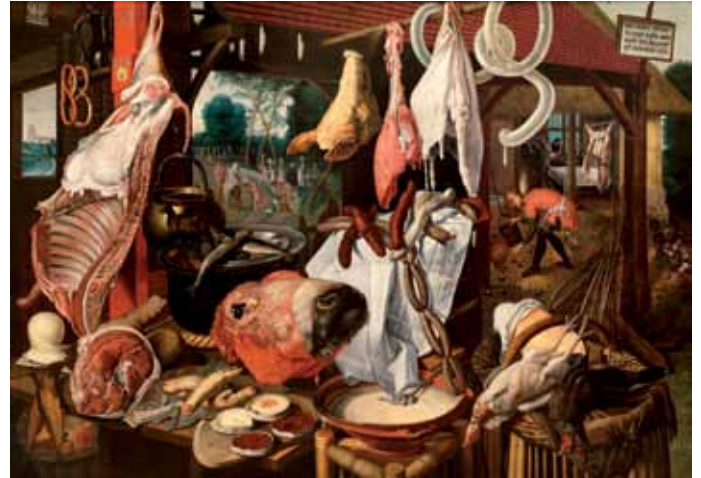
Pieter Aertsen, The Meatstall, 1551 – 1555 Bonnenfantenmuseum Maastricht

Certes, il ne s'agit pas simplement de juxtaposer des motifs, thèmes ou analogies formelles, mais plutôt de mettre en lumière une démarche qui souligne la proximité du quotidien grâce à une intelligence sensualiste qui représente la «Belle Vie» tout en déplorant sa perte. Une attitude qui, par ailleurs, soulève nombre de questions sur l'art lui-même. Le Baroque est presque toujours associé aux notions de dynamisme, de plaisirs des sens, de gaspillage, de mise