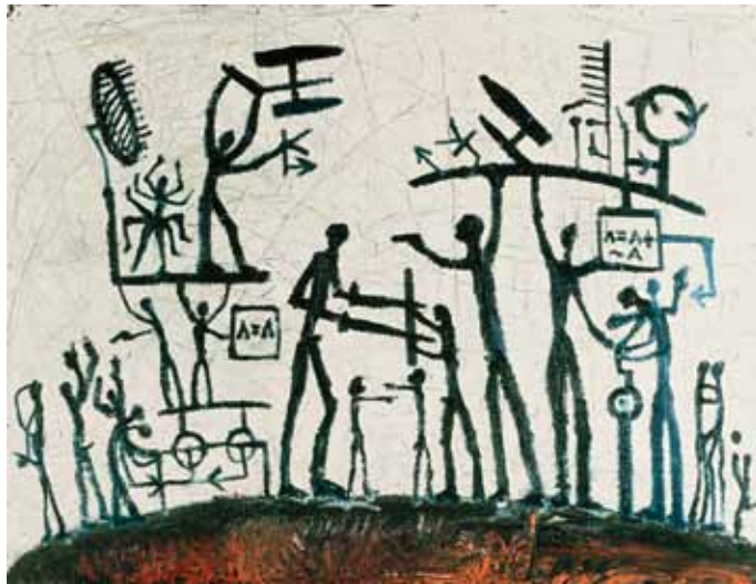
A. R. Penck (Ralf Winkler de son vrai nom), Weltbild, 1961 Kunsthau Zürich, Vereinigung Zürcher Kunstfreunde