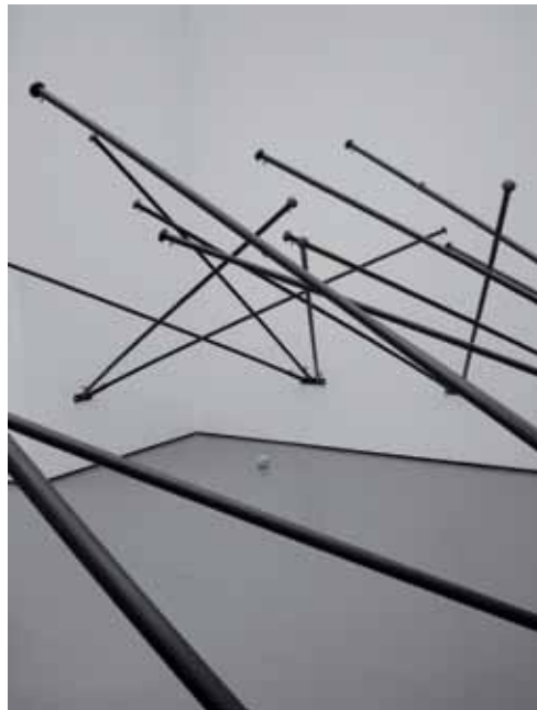
Latifa Echakhch, Fantasia (Empty Flag, Black), 2008; Globus, 2007 Vue de l'exposition «Shifting Identities», Kunsthaus Zürich, 2008 Courtesy of the artist et Kamel Mennour, Paris, © Latifa Echakhch

Maintenant le Kunsthaus Zürich a décidé de lui vouer une exposition personnelle pour lui permettre de présenter ses nouvelles créations. Dans ses oeuvres, Latifa Echakhch aborde des structures et des systèmes politiques et culturels. Elle reflète les regards d'autres, souvent teintés de préjugés vis-à-vis de l'inconnu, et remet en question les identités culturelles et religieuses dans des créations à la fois poétiques et conceptuelles.