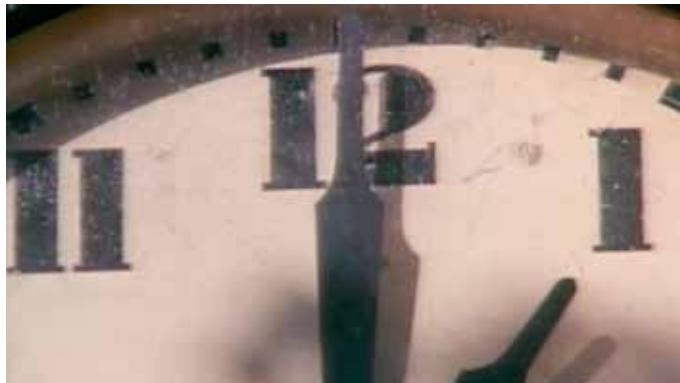
Image de: Christian Marclay, The Clock, 2010 Projection vidéo, 24 heures, © Christian Marclay, Courtesy White Cube

Ce collage, composé de milliers de clips provenant de milliers de films, place le temps et ses indicateurs au cœur de la création, non: toute l'œuvre est une mesure du temps qui passe. En effet, 24 heures durant, on voit défiler, minute par minute et extrait de film par extrait de film, une montre-bracelet, un réveil, un clocher qui, tous, indiquent une heure effective du lieu où ils se trouvent. Et tout comme dans la vraie vie, ces minutes qui passent, tantôt d'une lenteur pénible, tantôt dans un rythme effréné, sont intégrées dans des milliers d'histoires humaines sans que l'on sache jamais ce qui se passera... dans la minute qui suit.