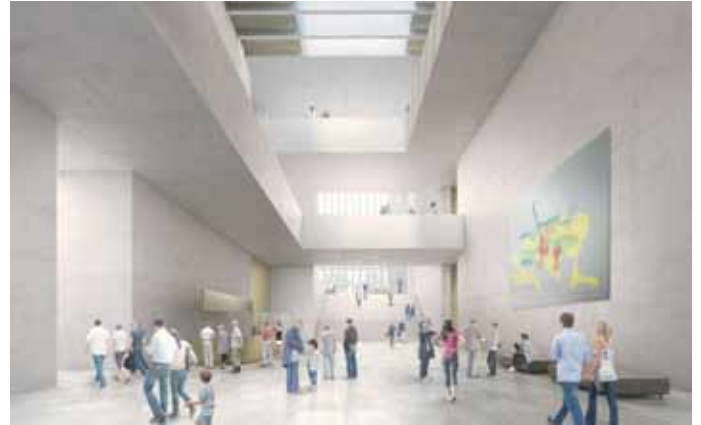
Vue du hall d'entrée État 2011, après clôture de l'avant-projet, © David Chipperfield Architects

Pour cette exposition, David Chipperfield créera des espaces spéciaux dans la Salle Bührle dont les dimensions, la conception et les flux de lumière se rapprocheront autant que possible de l'original. Ceci pour «tester» si les œuvres d'art et les visiteurs se plairont en ces nouveaux lieux, en espérant que le Nouveau Kunsthaus répondra, voire dépassera, les attentes de tous.