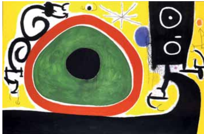
Joan Miró, Oiseaux en fête pour le lever du jour, 1968

Pour la première fois et en exclusivité, cent chefs-d'œuvre de cette collection privée tout à fait unique seront réunis au Kunsthaus Zürich. Cette première montre comment les préférences personnelles du collectionneur pour certains artistes se sont mués en centres de gravité de la collection: Pablo Picasso en est l'un des principaux artistes avec quantité d'œuvres de toutes ses périodes créatrices; Matisse, Modigliani et Kandinsky sont représentés par des séries d'œuvres majeures brillantes, et comme rien n'est trop beau, Claude