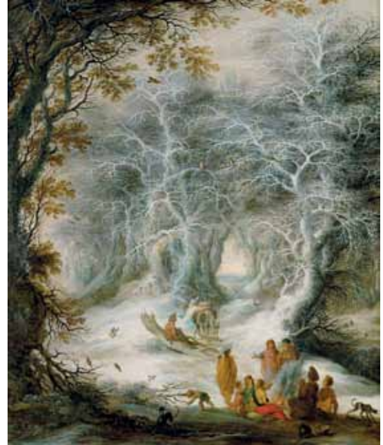
Scène hivernale avec gitans, première moitié du 17 ème siècle Kunsthistorisches Museum Wien, Gemäldegalerie

Avec le soutien de Zurich Compagnie d'Assurances SA.