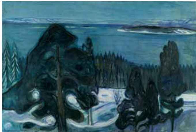
Edvard Munch, Nuit d'hiver, vers 1900 Kunsthau Zürich, © 2011 ProLitteris, Zurich

Avez-vous déjà vu les scènes burlesques représentant, aux Pays-Bas, les plaisirs du patinage, des activités gaillardes dans une alcôve, des courtisanes garnies de fourrure ou encore des enfants de paysans, grelottants? Le carnaval et les mets de Carême, le soleil d'hiver et les parties de boule de neige: aucune autre saison ne permet de déployer un éventail aussi vaste de sujets artistiques, que ce soit en peinture, en sculpture ou en arts plastiques.