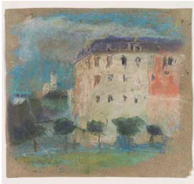
Albert Welti, Selnau près de Zurich, vers 1890 Schaffhausen, Museum zu Allerheiligen

Pour célébrer les 150 ans de la naissance de l'artiste, le Kunsthaus Zürich prépare la première exposition monographique vouée aux pastels d'Albert Welti (1862–1912). C'est dans le contexte de fin de siècle entre symbolisme et art nouveau que les pastels ont connu une sorte de renaissance. En Suisse, les tableaux décoratifs et abstraits d'Augusto Giacometti surtout, sorte de pionnier en la matière, figuraient parmi les premiers du genre à attirer l'attention de musées. L'exposition présente 45 paysages colorés appelés «Pastellnaturskizzen» par Welti et nous ne croyons pas exagérer en qualifiant de petits chefs-d'œuvre les «improvisations» nées, sous ses doigts, du contact direct avec la nature – des œuvres qui se démarquent très nettement de celles d'Arnold Böcklin, son maître. Les diverses fonctions d'un pastel sont expliquées par une série d'études en lien avec les tableaux et une eau-forte. La plupart de ces œuvres sont issues du legs de l'artiste au «Museum zu Allerheiligen» de Schaffhouse ainsi que de la collection du Kunsthaus et des collections privées.