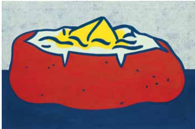
Roy Lichtenstein, Baked Potato, 1962 Kunsthaus Zürich, © 2011 ProLitteris, Zurich