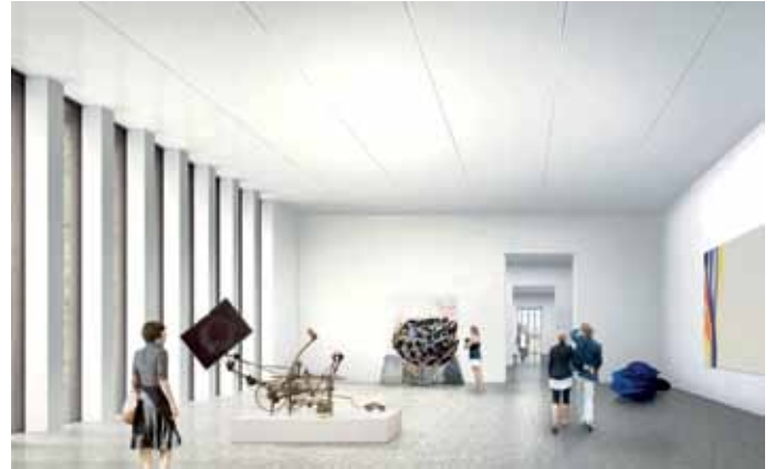
Salles de la collection pour l'art à partir de 1960, au 1 er étage État 2011, après clôture de l'avant-projet, © David Chipperfield Architects

Suivront encore des débats publics, des programmes portant sur la médiation dans l'art ainsi qu'une Journée de portes ouvertes, l'occasion de vous remercier de votre intérêt et de votre fidélité.