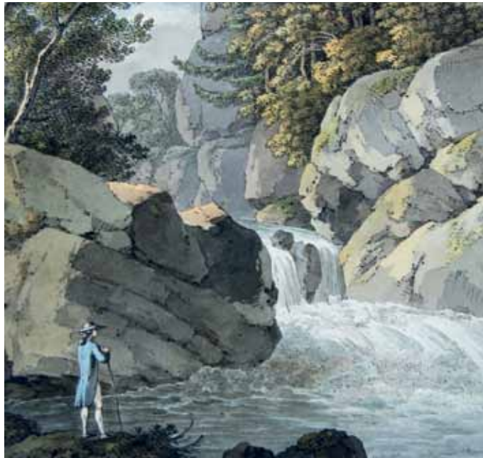
Adrian Zingg, Chute d'eau (détail), 1785 Dresde, Kupferstichkabinett

Le Kunsthhaus Zürich présente la première exposition consacrée à l'un des artistes les plus marquants d'une époque située entre les Lumières européennes et le Prérromantisme de Dresde: Adrian Zingg (1734–1816). Né à St-Gall, il accomplit sa formation auprès du graveur J.R. Holzhalb à Zurich puis de J.L. Aberli à Berne. Après une collaboration de sept ans dans l'atelier de J.G. Wille à Paris, il enseignera 50 ans durant la gravure sur cuivre et le dessin de paysage à la Kunstakademie de Dresde. Ses excursions sur le motif l'ont rendu célèbre. Ensemble avec Anton Graff, autre Helvète et ami artiste, Zingg parcourt les vallées pittoresques de l'Elbe, vaste région que l'on retrouvera dans grand nombre de ses paysages, et qui seront connues sous le nom de Suisse saxonne. Les lavis de Zingg ont influencé toute une génération jusqu'à C.D. Friedrich et L. Richter. Par ailleurs, son choix de motifs a marqué de son empreinte la production de souvenirs qui commencèrent à faire leur apparition à la naissance du tourisme. L'exposition est organisée par le Kupferstichkabinett de Dresde en collaboration avec le Kunsthhaus Zürich.