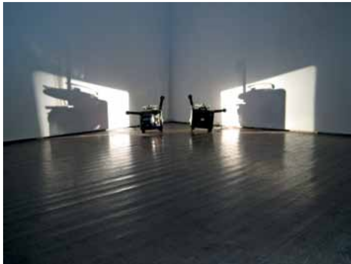
Rosa Barba, Western Round Table, 2007

Le Kunsthaus Zürich est le premier musée en Suisse à lui consacrer une exposition individuelle. L'artiste va réaliser de nouvelles œuvres qui seront présentées en exclusivité ici. Elle axe ses créations sur le film avant tout, le disséquant et l'analysant. Elle y recourt non seulement pour véhiculer des images, mais comme matériau pour ses installations sculpturales. Un travail méticuleux qui permet à l'artiste de marier à merveille l'analytique et le sensuel.