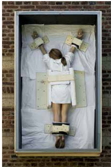
Maurizio Cattelan, Sans Titre, 2007 Marian Goodman Gallery, New York, © Maurizio Cattelan