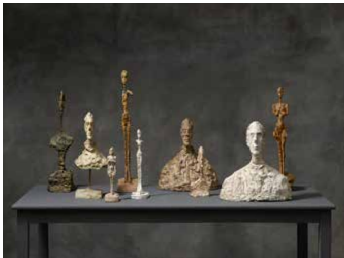
Alberto Giacometti, Œuvres 1949–1965 Kunsthaus Zürich, Alberto Giacometti-Stiftung, photo: Dominic Büttner, © Succession Alberto Giacometti / 2016 ProLitteris, Zurich

Sculpteur, peintre et dessinateur, Alberto Giacometti (1901–1966) est l'artiste de tous les superlatifs. Cette grande exposition au Kunsthaus, la première qui lui soit consacrée depuis 2001, propose à travers plus de 150 chefs-d'œuvre une véritable exploration de l'essence artistique de son travail sous une forme inédite jusqu'à présent.