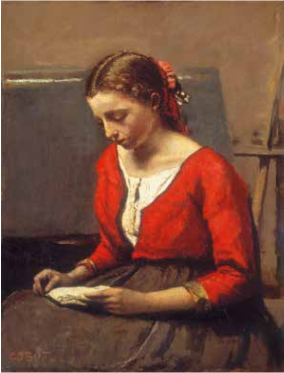
Camille Corot, Jeune fille lisant, vers 1845/1850 Fondation Collection E. G. Bührle, Zurich

Romantisme, réalisme, naturalisme, peinture de plein air et impressionnisme restent dans les pays germanophones les termes clés utilisés pour caractériser la peinture française du 19 ème siècle. Certains artistes appartenant à ces différents styles, comme Géricault, Delacroix, Corot, Daumier, Millet, Courbet, Manet, Sisley, Monet et Renoir, ont alors quitté la «voie officielle» de la peinture, l'académisme et le néo-classicisme. Malgré leur approche révolutionnaire, nombre d'entre eux restaient plutôt traditionalistes. Extrêmement controversés de leur vivant, ils comptent aujourd'hui parmi ces «précurseurs de la modernité» auxquels le monde entier rend hommage. Cependant, la peinture française du 19 ème →