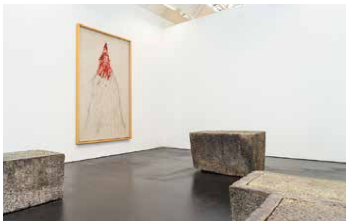
Art postérieur à 1945

Des audioguides fournissent des informations détaillées sur plus de 200 œuvres ainsi que sur l'architecture du Kunsthaus.