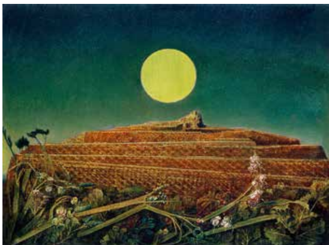
Max Ernst, La ville entière, 1935/36 Kunsthaus Zürich, © 2016 ProLitteris, Zurich