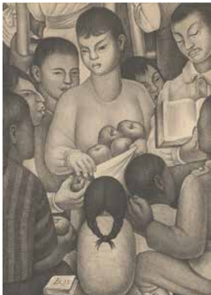
Diego Rivera, Los frutos de la educación / Los frutos de la tierra, 1932 Kunsthaus Zürich