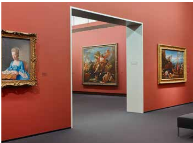
Maîtres anciens

Chronologiquement, la présentation de la collection s'ouvre sur des sculptures médiévales et les retables du gothique tardif des Maîtres aux œillets. La peinture néerlandaise du 17 ème siècle est brillamment représentée par des œuvres de Rembrandt, Rubens, Ruisdael; des toiles en petit nombre mais de grande qualité évoquent la production de Rome à la même époque, avec entre autres Claude Lorrain,