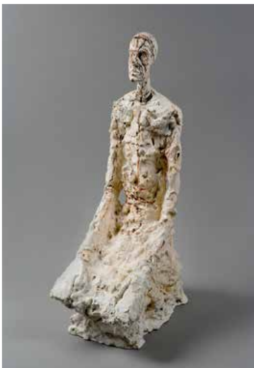
Alberto Giacometti, Homme à mi-corps, 1965 Fondation Alberto et Annette Giacometti, Paris, © Alberto Giacometti Estate, 2016 et Succession Alberto Giacometti/2016 ProLitteris, Zurich

présentées dans des sortes de cabines de la dimension d'un atelier, réparties dans la grande salle, tandis que les espaces intermédiaires vacants seront réservés aux célèbres bronzes. Les œuvres émouvantes créées par Alberto Giacometti lui-même rencontreront ainsi les bronzes réalisés de son vivant déjà à partir d'elles, qui l'ont fait connaître dans le monde entier.