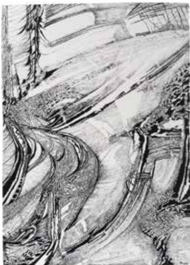
Peter Wechsler, Sans titre, 2016 Collection particulière

Peter Wechsler (né en 1951) a grandi à Zurich, aujourd'hui il vit et travaille à Vienne. Il appartient à une génération d'artistes non-figuratifs qui depuis les années 1990 ont ouvert à de nouveaux domaines d'expression et de contemplation le dessin conçu comme expérience sensorielle, dans le sillage du minimalisme et de l'art conceptuel. La question fondamentale qui sous-tend cette démarche est la suivante: comment est-il possible de créer, en recourant systématiquement aux moyens du dessin, des espaces et des structures concrètes pour activer et stimuler la perception sensorielle de l'observateur? L'exposition «Par petits bouts le monde s'agrège» reconstruit, à travers dix travaux majeurs, un cycle de dessins au crayon de grand format particulièrement impressionnants. D'autre part, le Kunsthaus est le premier musée d'art à proposer une sélection de dessins très récents réalisés à l'encre de Chine et au pinceau. Quelques autres œuvres de jeunesse des années 1970 et 1980 sont également présentées. L'ensemble, qui comprend plus de 70 dessins, offre un panorama représentatif de l'œuvre dessinée de cet artiste.