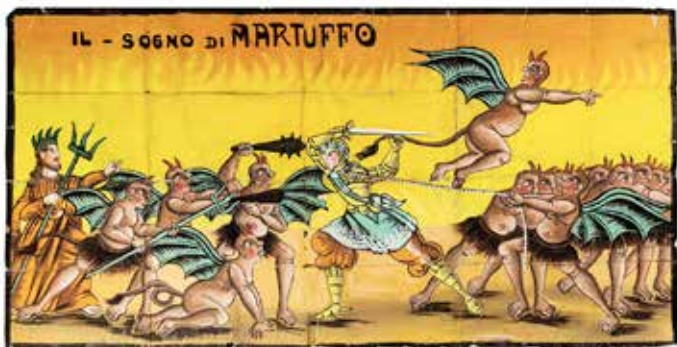
Illustration du héros «Guido Santo» Collection Würth, Künzelsau, photo: Francesco Noferini

Les «Cantastorie», collection inconnue et fascinante de cycles d'images transmises précieusement de génération en génération, appartenaient à deux familles d'artistes de rue et de marionnettistes de Naples et de Foggia. En les montrant aux spectateurs, ils leur mettaient littéralement à portée de main les grands thèmes de la culture. Ce furent pour ainsi dire les premières bandes dessinées – de belles princesses, d'héroïques chevaliers, des batailles sauvages, des histoires épouvantables et des monstres voraces. Une centaine de chefs-d'œuvre chatoyants de l'art populaire, datant des premières décennies du 20 ème siècle, ont été restaurés pour être exposés au Kunsthau et fêter leur toute première entrée dans un musée. Cette fois, nous mettons à bas les vieux canons éculés de la «culture noble». Incontestablement les «Cantastorie» sont un plaisir édifiant et plein d'humour pour les sens et les yeux, mais ils doivent être expliqués pour prendre vraiment vie. D'où la présence d'une scène au milieu de l'exposition: concerts, manifestations et moments festifs transformeront la vénérable salle d'exposition de plus de 1000m 2 en une véritable place de marché, un lieu d'échanges vivant.