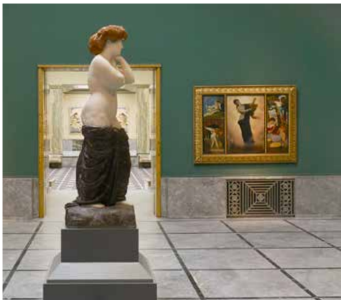
Art suisse

Domenichino, Lanfranco. Puis c'est au tour du Settecento vénitien de Tiepolo à Guardi, avec des œuvres tout aussi remarquables. La peinture zurichoise postérieure à la Réforme fait preuve d'originalité, des portraits de Hans Aspers aux œuvres de Füssli, génie excentrique ayant marqué de son empreinte le classicisme européen.