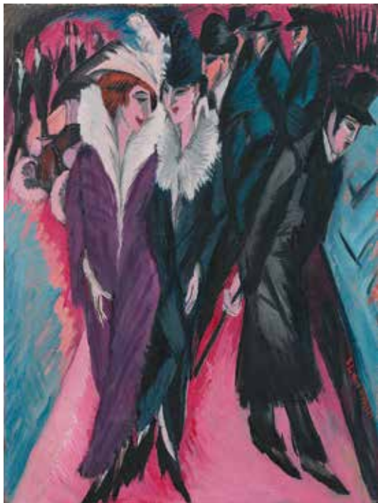
Ernst Ludwig Kirchner, La rue, Berlin, 1913 The Museum of Modern Art, New York, © 2016, Digital image, The Museum of Modern Art, New York/Scala, Florence

C'est le grand maître de l'expressionnisme: Ernst Ludwig Kirchner (1880–1938). Les quelque 150 œuvres rassemblées dans l'exposition «Métropole trépidante/Nature idyllique. Kirchner – Les années berlinoises» retracent sa phase créative la plus novatrice, de 1911 à 1917, quand l'artiste vivait à Berlin. La présentation est axée sur le contraste entre sa vie dans la capitale allemande, grande ville vibrionnante, et sur l'île paisible de Fehmarn, sur la Baltique, où il passa ses étés de 1912 à 1914. Ces deux sources d'inspiration étaient en tous points opposées, pourtant, les œuvres créées à cette époque témoignent toutes d'une même aspiration à une vie hors des normes bourgeoises et à une forme d'expression nouvelle, «originelle».