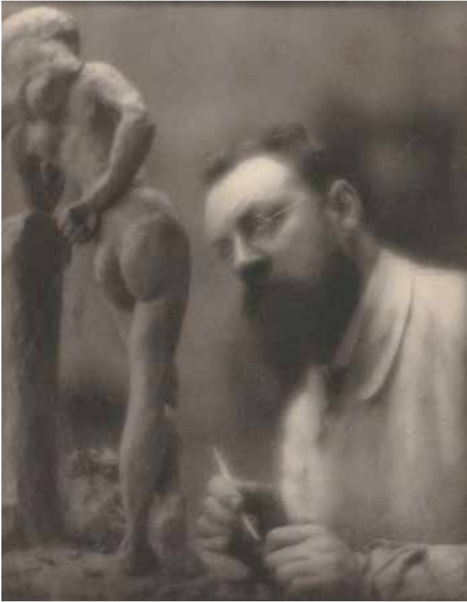
Henri Matisse, Nu de dos (I-IV), 1908 – 1930 Kunsthau Zürich