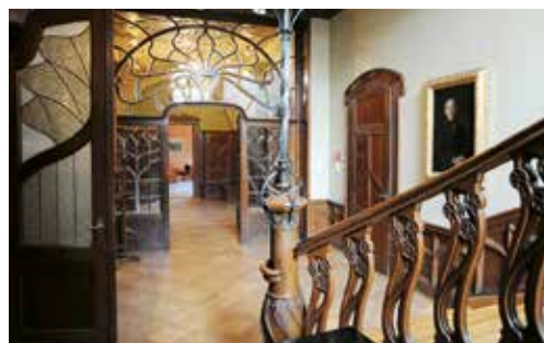
Photo salle de conférences, photo Villa Tobler