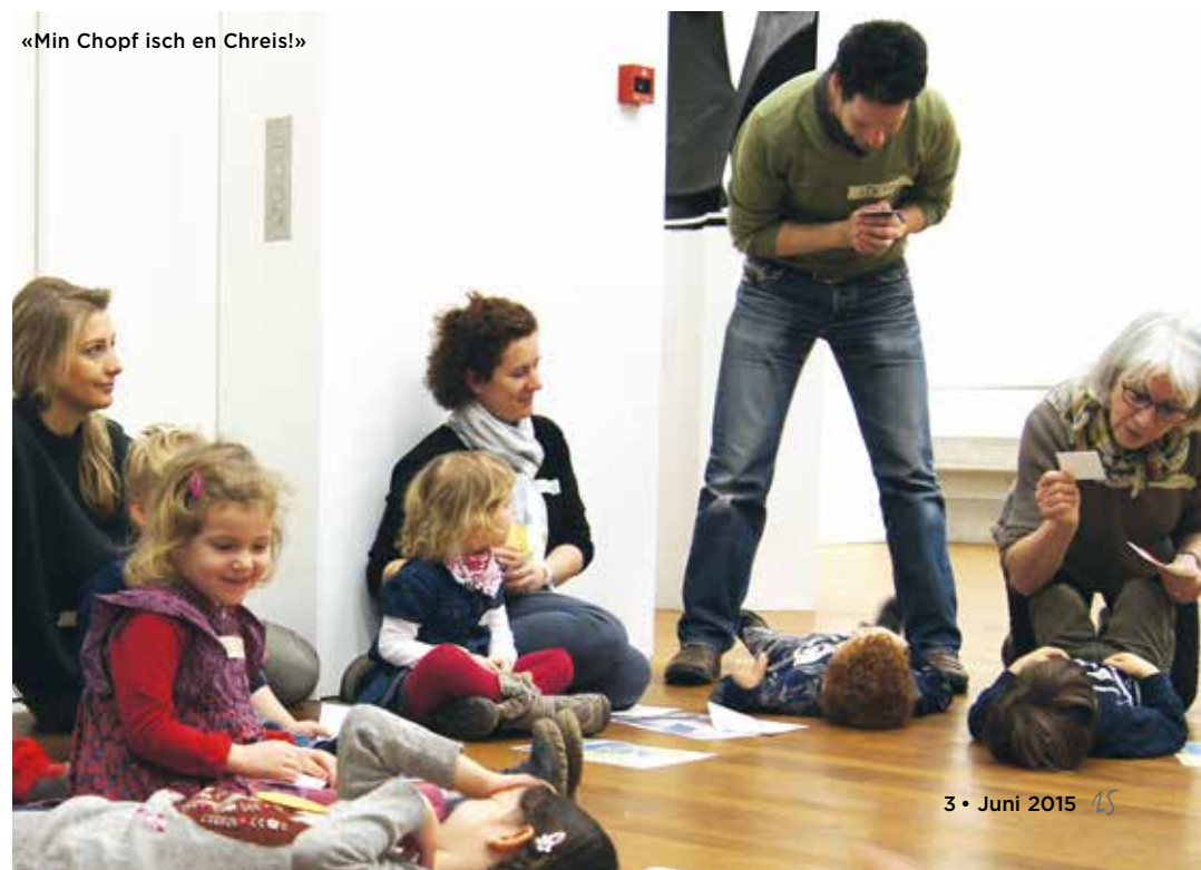
«Min Chopf isch en Chreis!»