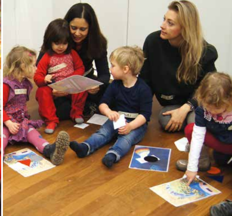
Farben und Formen faszinieren Kleine wie Grosse.