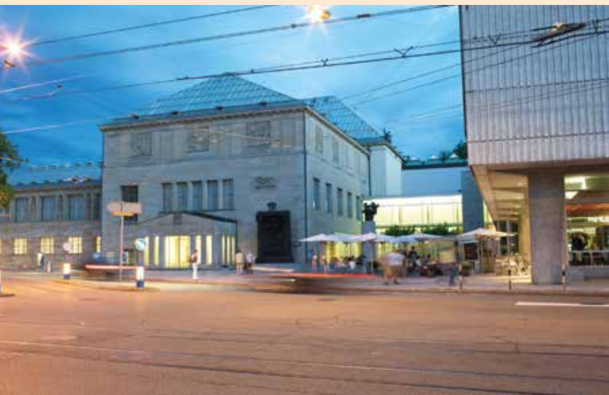
Kunsthaus Zürich

rungen oder erschliessen sich eigene Interessen, die bisher verborgen waren. Plötzlich malt ein Kind mit Freude, das bislang noch keinen Pinselstrich getan hat. Macht Aussagen zu grossen Werken der bildenden Kunst – und das Beste: Jemand hört wirklich zu und nimmt jedes Wort ernst. Das hinterlässt Spuren unterschiedlichster Art, und dass man den Kindern zutraut, mit kostbaren Kunstwerken einen Umgang zu finden, lässt sie fast sichtbar wachsen.