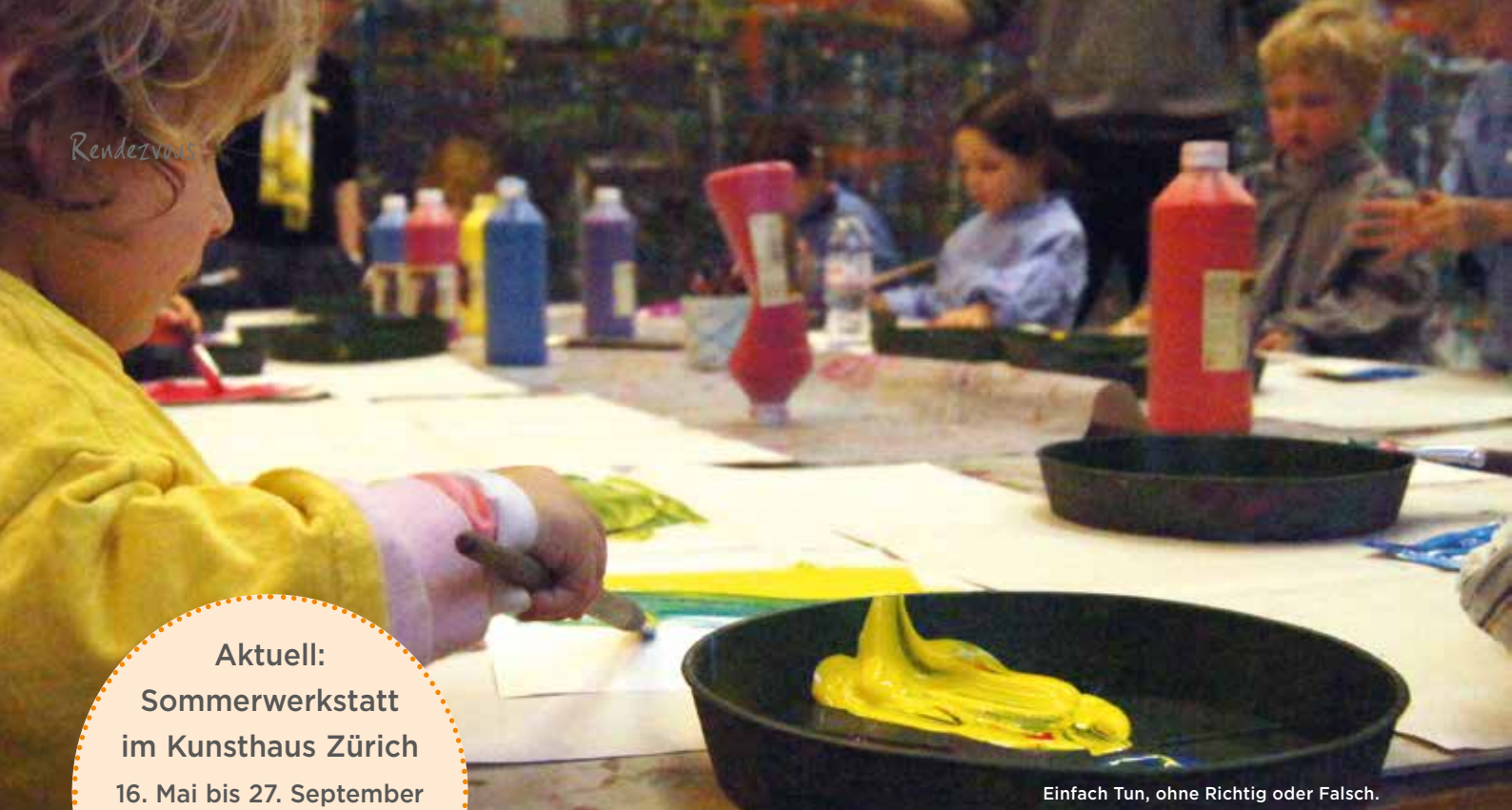
Einfach Tun, ohne Richtig oder Falsch.

Aktuell: Sommerwerkstatt im Kunsthaus Zürich 16. Mai bis 27. September Workshop für Spielgruppen: Ab ins Wi-Wa-Wunder- land!