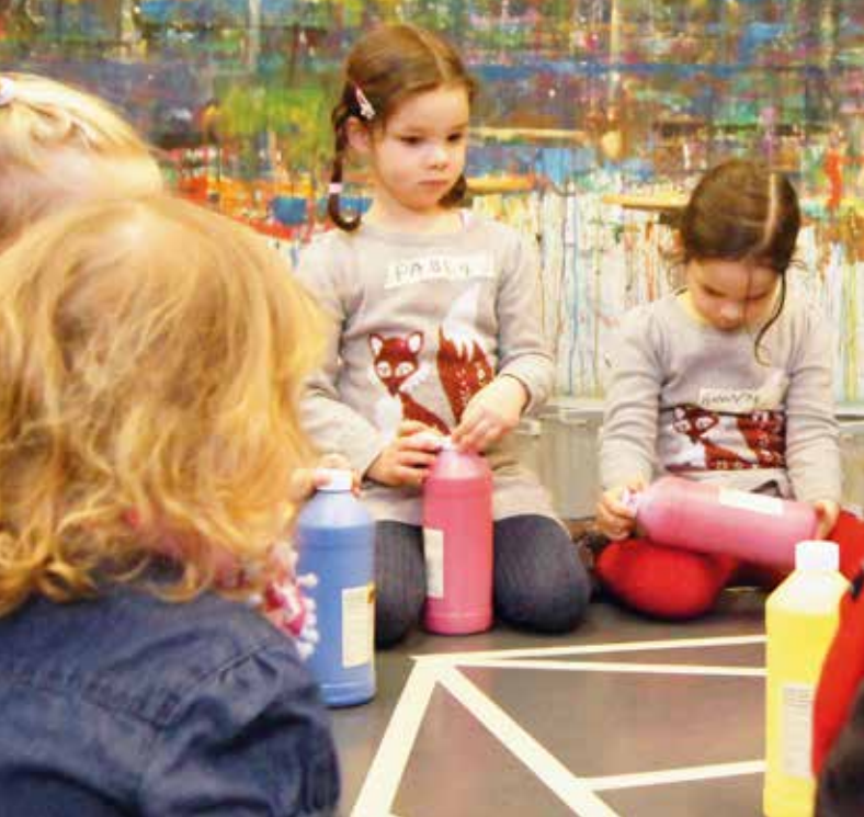
Hmmm, wo wohnt das Rot im Farbenhaus?