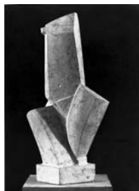
Torse [Torso], 1925 Gips, 58 x 25 x 24 cm Kunsthau Zürich Alberto Giacometti-Stiftung © 2007 ProLitteris, Zürich