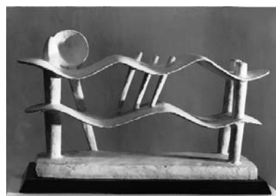
Femme couchée qui rêve [Träumende Frau], 1929 Bronze, weiss bemalt, 244 x 43 x 13,5 cm Kunsthau Zürich, Alberto Giacometti-Stiftung