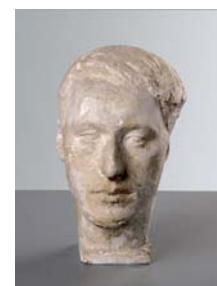
Bruno Giacometti, um 1930 Gips, 31 x 18,5 x 24,5 cm Kunsthau Zürich, Alberto Giacometti-Stiftung Geschenk Bruno und Odette Giacometti, 2006