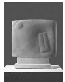
Femme [Frau], 1928/29 Marmor, 33,5 x 31 x 9 cm Kunsthau Zürich Alberto Giacometti-Stiftung © 2007 ProLitteris, Zürich