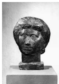
La mère de l'artiste [Die Mutter des Künstlers], 1927 Bronze, 32,5 x 23 x 11 cm Alberto Giacometti-Stiftung Dauerleihgabe im Kunstmuseum Basel © 2007 ProLitteris, Zürich