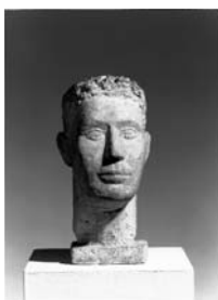
Selbstbildnis, 1925 Gips, 41 x 21 x 28 cm Kunsthau Zürich Alberto Giacometti-Stiftung © 2007 ProLitteris, Zürich