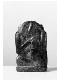
Petit homme accroupi [Kauerndes Männchen], 1926 Bronze, 28,5 x 17,5 x 10 cm Kunsthau Zürich Alberto Giacometti-Stiftung © 2007 ProLitteris, Zürich