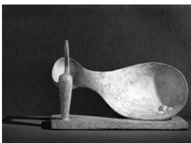
Femme couchée [Liegende Frau], 1929 Gips, 28 x 44,5 x 16,5 cm Kunsthau Zürich, Alberto Giacometti-Stiftung © 2007 ProLitteris, Zürich