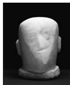
Le père de l'artiste [Der Vater des Künstlers], 1927 Marmor, 30 x 23 x 21 cm Privatbesitz Schweiz © 2007 ProLitteris, Zürich