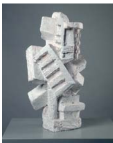
Composition cubiste [Kubistische Komposition], 1926/1927 Gips, Höhe 51,5 cm Kunsthau Zürich, Alberto Giacometti-Stiftung Geschenk Bruno und Odette Giacometti, 2006