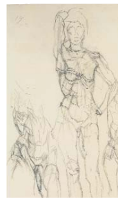
Drei Akte, 1923/24 Bleistift auf Papier, 44,5 x 28 cm Kunsthau Zürich Alberto Giacometti-Stiftung © 2007 ProLitteris, Zürich