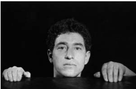
Alberto Giacometti, 1931