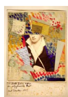
Kurt Schwitters Für Carola Giedion-Welcker Ein fertiger Poet, 1947 Collage, 20 x 17 cm Privatbesitz