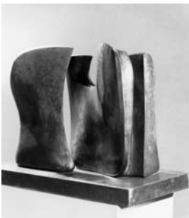
Henry Moore Knife-Edge Two Piece, 1962 Bronze, 44,5 x 61 x 21 cm Kunsthhaus Zürich © 2007 The Henry Moore Foundation