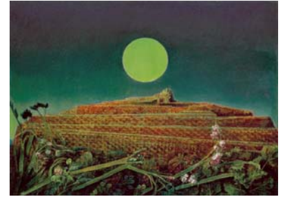
Max Ernst La ville entière, 1935/36 Öl auf Leinwand, 60 x 81 cm Kunsthhaus Zürich © 2007 ProLitteris, Zürich