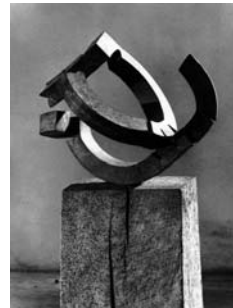
Eduardo Chillida Yunque de Suenos IX (Amboss der Träume), 1959 Schmiedeeisen auf Holzsockel, 47 x 55 x 32 cm Höhe des Sockel 92 cm Kunsthhaus Zürich, Vereinigung Zürcher Kunstfreunde