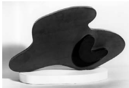
Hans Arp Main-Fruit, 1927/28 Holz, bemalt, 27 x 43 x 16 cm Kunsthhaus Zürich, Legat Erna und Curt Burgauer © 2007 ProLitteris, Zürich