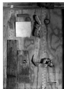
Kurt Schwitters Bild mit Hobelspänen, 1932 Assemblage auf Holz, 52,5 x 35,5 cm Kunsthhaus Zürich, Privatbesitz