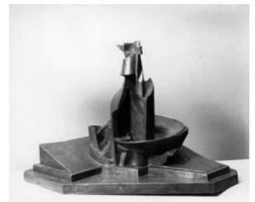
Umberto Boccioni Sviluppo di una bottiglia nello spazio (Entwicklung einer Flasche im Raum), 1912 Bronze, 39 x 60 x 30 cm Kunsthhaus Zürich