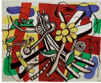
Fernand Léger La fleur jaune, 1944 Öl auf Leinwand, 74 x 91,5 cm Kunsthhaus Zürich Geschenk in memoriam C. und S. Giedion-Welcker