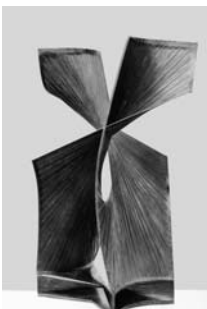
Antoine Pevsner Colonne développable de la victoire (Entfaltbare Siegesäule), 1956 Bronzeblech, gelötet und oxydiert 104 x 79 x 67 cm Kunsthhaus Zürich © 2007 ProLitteris, Zürich