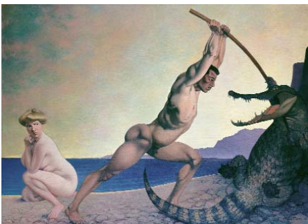
Félix Vallotton Persée tuant le dragon, 1910 Öl auf Leinwand, 160 x 225 cm Musée d'art et d'histoire, Genf