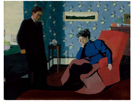
Félix Vallotton Intérieur fauteuil rouge et figures, 1899 Gouache auf Karton, 46,5 x 59,5 cm Kunsthhaus Zürich Geschenk von Ottilie Roederstein, 1920