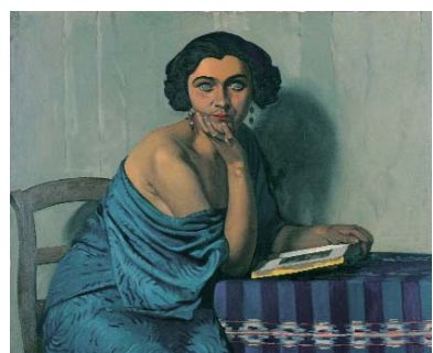
Félix Vallotton Le retour de la mer, 1924 Öl auf Leinwand, 81 x 100 cm Musée d'art et d'histoire, Genf