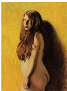
Félix Vallotton Nu sur fond jaune, 1922 Öl auf Leinwand, 100 x 73 cm The Barrett Collection, Dallas TX