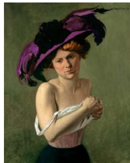
Félix Vallotton Le chapeau violet, 1907 Öl auf Leinwand, 81 x 65,5 cm Villa Flora, Winterthur