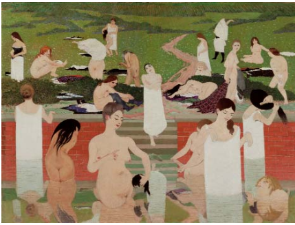
Félix Vallotton Le bain au soir d'été, 1892/93 Öl auf Leinwand, 97 x 131 cm Kunsthhaus Zürich Leihgabe der Gottfried Keller Stiftung