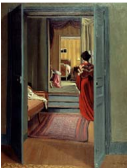
Félix Vallotton Intérieur avec femme en rouge de dos, 1903 Öl auf Leinwand, 93 x 71 cm cm Kunsthhaus Zürich Vermächtnis Hans Naef