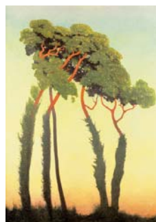
Félix Vallotton Derniers Rayons, 1911 Öl auf Leinwand, 100 x 73 cm Musée des beaux-arts, Quimper