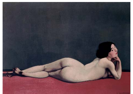
Félix Vallotton Nu couché au tapis rouge, 1909 Öl auf Leinwand, 73 x 100 cm Musée du Petit Palais, Genf