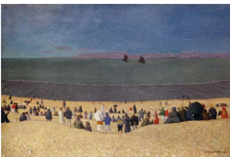
Félix Vallotton La plage à Honfleur, 1919 Öl auf Leinwand, 54 x 81 cm Privatbesitz